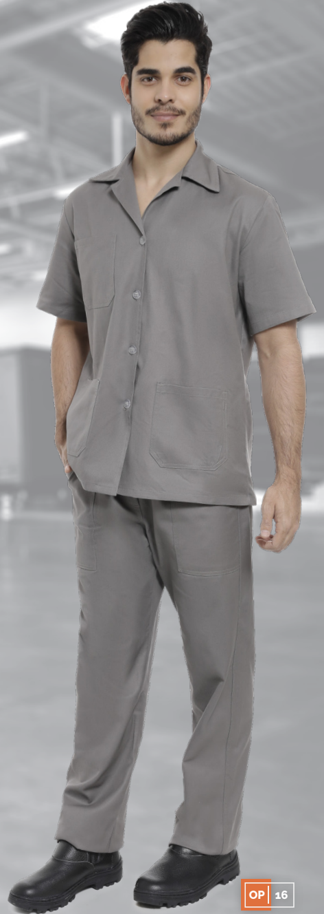
OP | 16