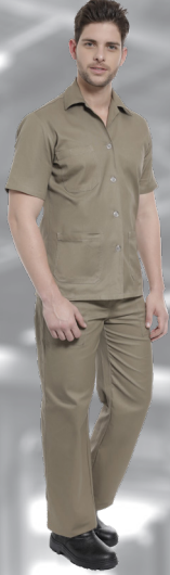
OP | 06