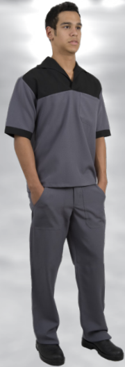
OP | 13