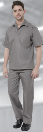
OP | 08