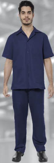
OP | 07