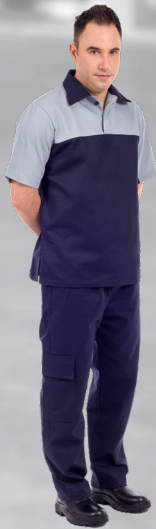
OP | 14