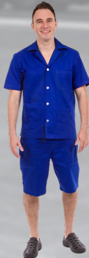
OP | 15